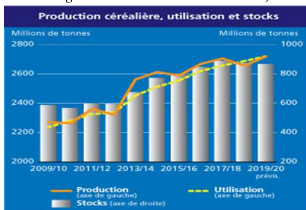
Figure 1 : Production céréalière, utilisation et stocks

Les prévisions de la FAO en ce qui concerne les stocks mondiaux de céréales à la clôture des campagnes se terminant en 2020 ont été relevées de 2,4 millions de tonnes et portées à près de 866 millions de tonnes, le rapport stocks-utilisation de céréales à l'échelle mondiale se maintenant ainsi à un niveau confortable : 30,9 pour cent, comme indiqué aux niveaux des graphiques ci-dessous ;